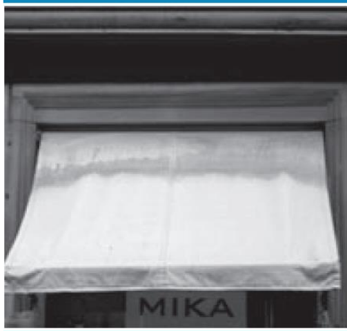
unsightly mould spots on shop window awnings