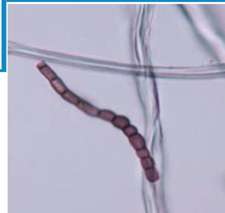
mould fungi (microscopic picture) cause mould spots